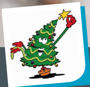
Geste éco-citoyen, broyage du sapin.