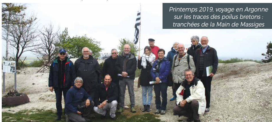
Printemps 2019, voyage en Argonne sur les traces des poilus bretons : tranchées de la Main de Massiges