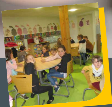
Vie périscolaire, garderie