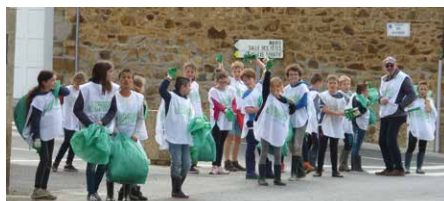
Les élèves de CM1 CM2 au retour de leur nettoyage de la nature.

La classe de CM2 a participé à l'opération « Nettoyons la nature » organisée par les centres Leclerc pour la troisième année consécutive. Ils ont nettoyé le site de l'Isle et le ruisseau. Comme les années passées, ils ont ramassé une quantité importante de déchets : bouteilles en verre, plastique, cartons, carcasse de moto, ... De retour à l'école les élèves ont trié les déchets. « Un geste concret pour la protection de l'environnement ». Le comportement citoyen et le travail de recyclage vont être poursuivis en classe