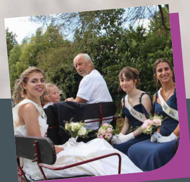
Reines de Goudelin