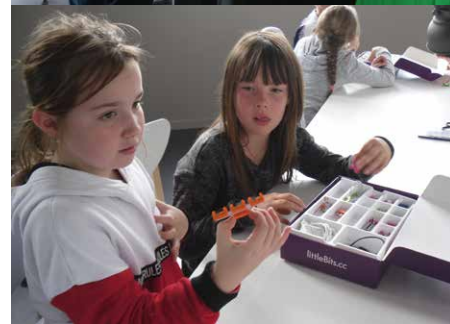
Les CM1 CM2 en action lors des ateliers « fête de la science » organisée par le petit Echo de la Mode